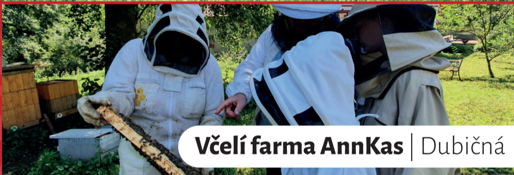
Včelí farma AnnKas | Dubičná