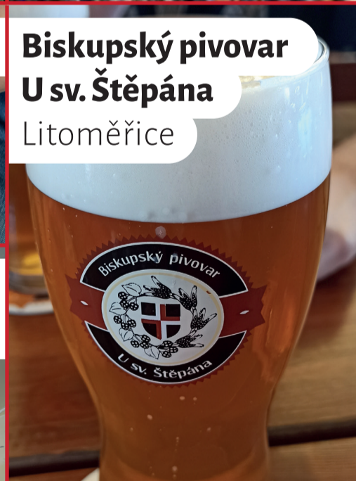
Biskupský pivovar U sv. Štěpána Litoměřice