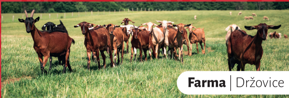
Farma | Držovice