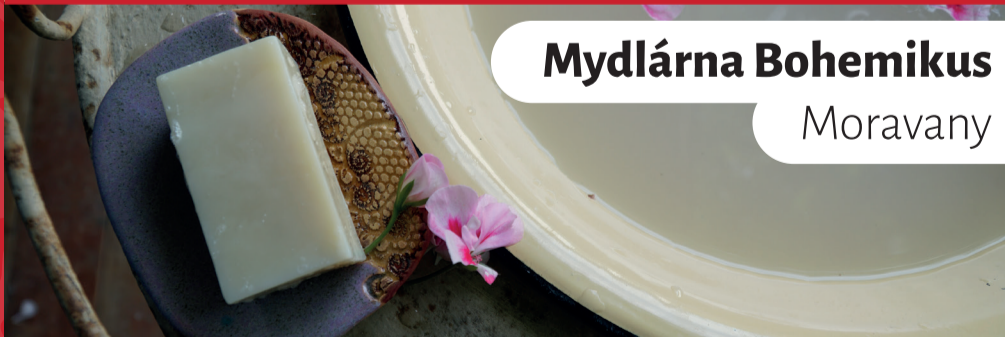
Mydlárna Bohemikus Moravany