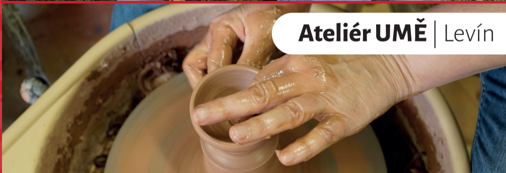
Ateliér UMĚ | Levín