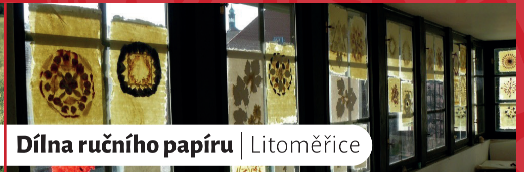
Dílna ručního papíru | Litoměřice