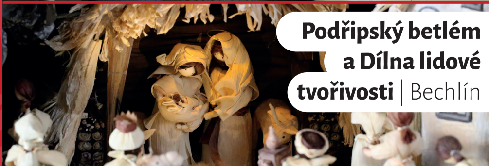
Podřipský betlém a Dílna lidové tvořivosti | Bechlín